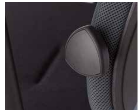
Lumbar support depth adjustment with a knob. | Lordosenstütze, in der Tiefe einstellbar mit Hilfe eines Drehknopfs