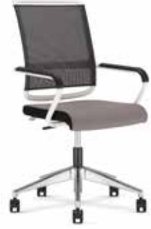
Xenium conference swivel chair X-Cross Mesh TILT/AR/AG