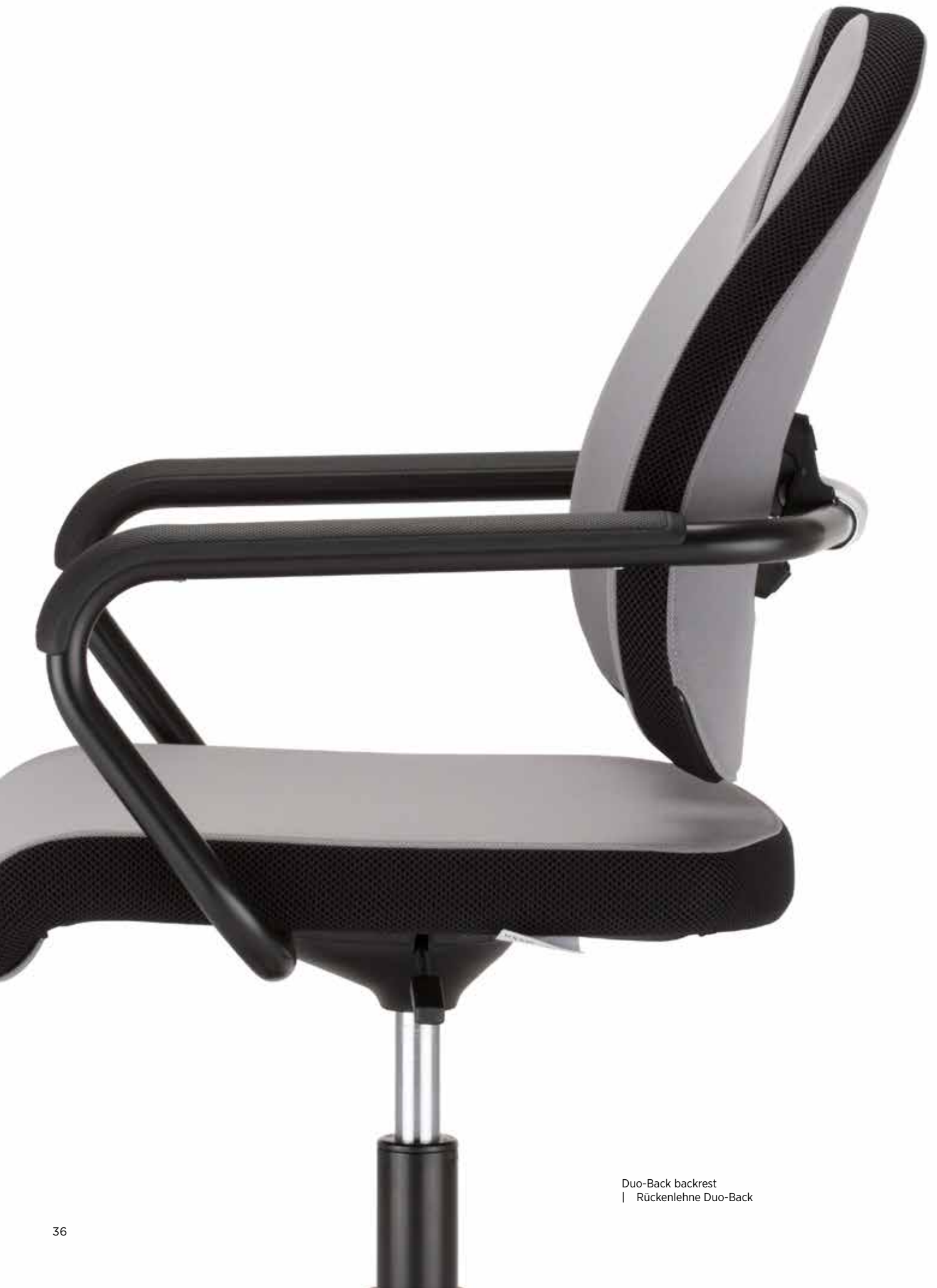
Duo-Back backrest | Rückenlehne Duo-Back