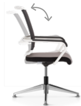
Tilt mechanism | Wippmechanik