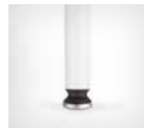
Articulated glides | Gelenkgleiter