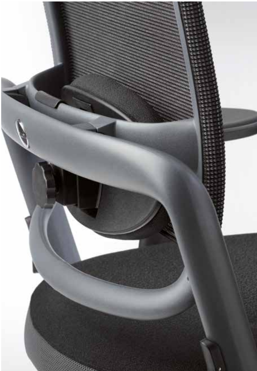
Lumbar support for mesh version depth-adjustable upholstered cushion | Lordosenstütze für Mesh Rückenlehne in der Tiefe einstellbar

Die gepolsterte Kopfstütze kann, dank ihrer flexiblen Halterung, dem Nutzer individuell angepasst werden - das erhöht den Arbeitskomfort und entlastet gleichzeitig die Muskulatur von Schulter und Nacken.