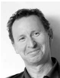
Designed by Martin Ballendat

Ein ansprechendes Design gepaart mit überzeugender Flexibilität sind Eigenschaften, die die Sitzmöbelserie Xenium auszeichnen. Die Stühle passen sich der Körperform des Nutzers optimal an und garantieren so ergonomischen Komfort in jeder Position. Die Stuhlserie Xenium wurde in Funktion und Design für höchste Ansprüche konzipiert.