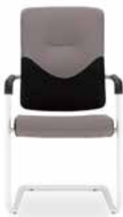
Xenium frame chair CF UPH/Plastic CFPS-W/B