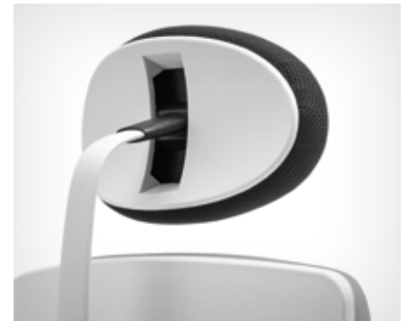
Headrest | Kopfstütze