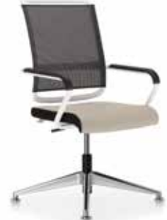
Xenium conference swivel chair X-Cross Mesh TILT/AR/AG