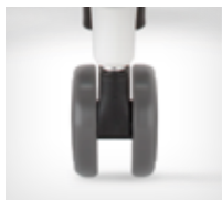
Castors for hard floors | Rollen für Hartböden