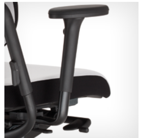
Armrest (4-D) | Armlehne (4-D)