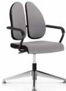
Xenium conference swivel chair X-Cross Duo-Back TILT/AR/AG