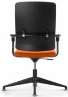
Xenium conference swivel chair X-Cross UPH/Plastic TILT/AR/AG