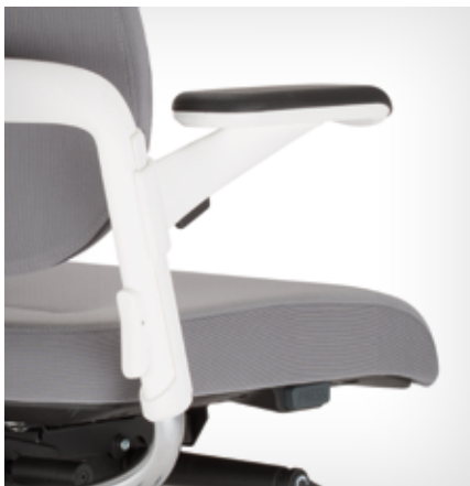
Armrest (2-D) mounted to the rear frame of the backrest | Armlehne (2-D), montiert am Rahmen der Rückenlehne

Die Armauflagen der 2-D-Armlehnen haben ein schwarzes oder graues Polyurethan-Pad, das um 44° schwenkbar ist. Je nach Version ist die Armlehnenabdeckung in schwarzem, grauem oder weißem Kunststoff erhältlich.