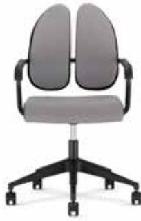
Xenium conference swivel chair X-Cross Duo-Back