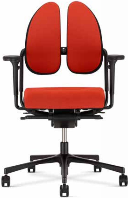
Xenium swivel chair Duo-Back