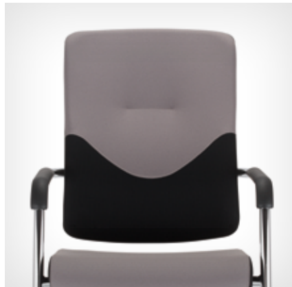
Upholstered backrest (UPH/Plastic) | gepolsterte Rückenlehne (UPH/Plastic)