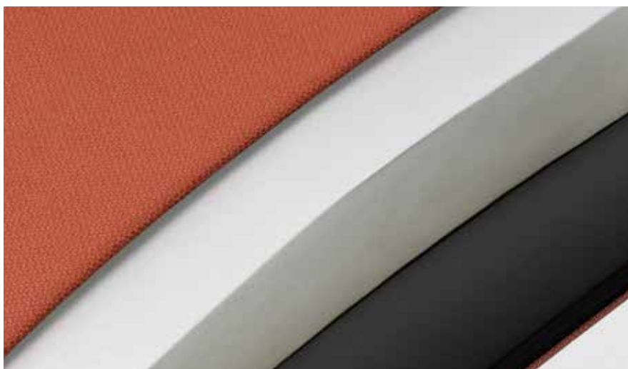
Deformation-resistant cast foam | Verformungsbeständiger Formschaum