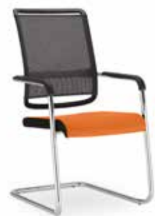
Xenium frame chair CF Mesh CFPS-CR/B