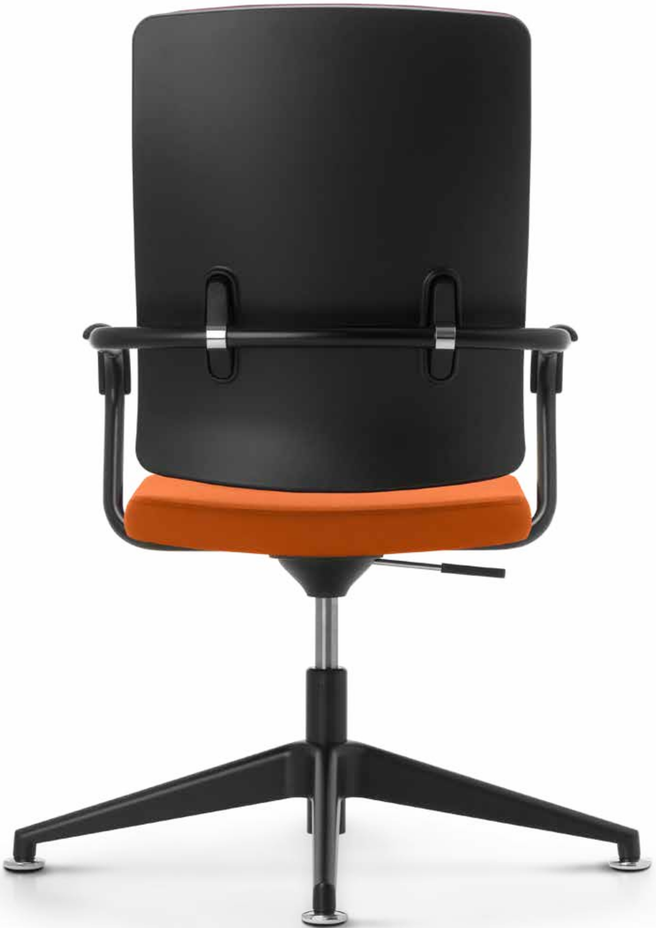
4-star base made of black powdercoated aluminium | Vierarmiges Fußkreuz aus pulverbeschichtetem Aluminium schwarz