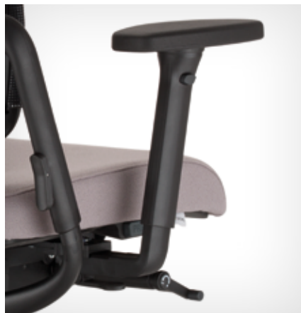
Armrest (3-D) | Armlehne (3-D)