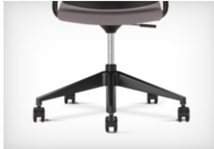
5-star base made of black powdercoated aluminium | Fünfarmiges Fußkreuz aus pulverbeschichtetem Aluminium schwarz