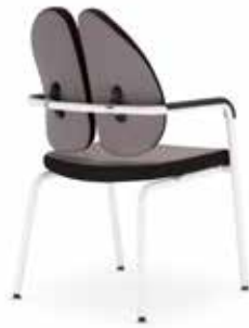
Xenium frame chair 4L Duo-Back 4L-ARM-W/B