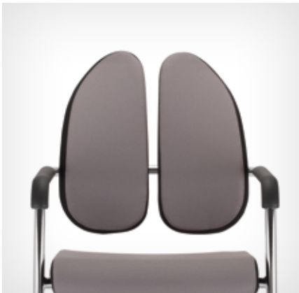
Duo-Back backrest | Rückenlehne Duo-Back

Bei den Beistell- und Konferenzstühlen gibt es ebenfalls drei Rückenlehnenversionen (Duo-Back, UPH/Plastic und Mesh).