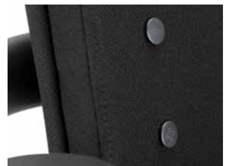
Lumbar support - pneumatic depth-adjustment | Pneumatische Tiefeneinstellung der Lordosenstütze