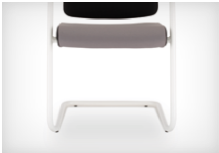
Cantilever base | Freischwingergestell