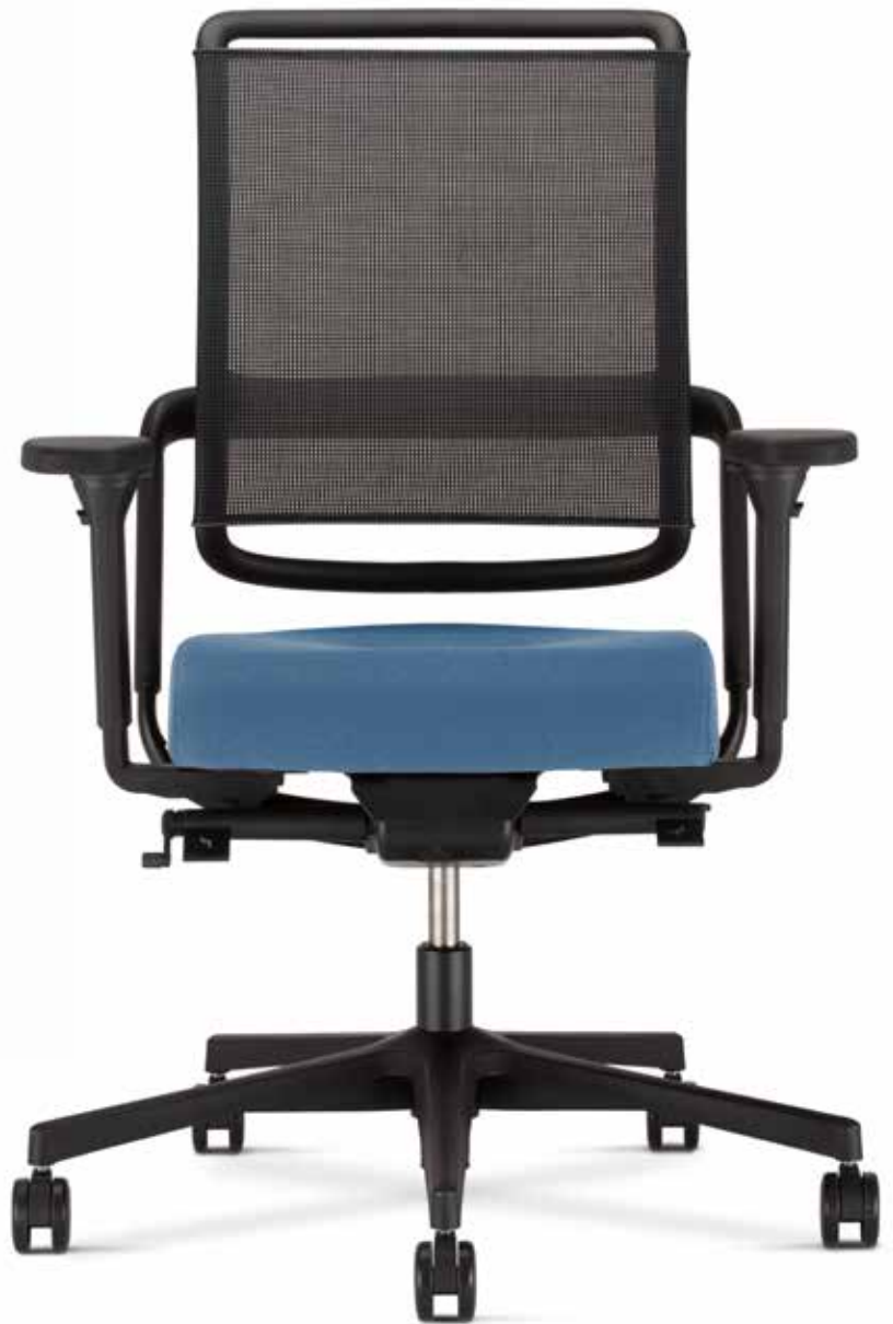
Xenium swivel chair Mesh