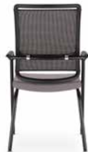
Xenium frame chair 4L Mesh 4L-ARM-BL/B