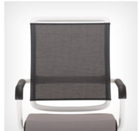
Mesh backrest (Mesh) | NetZRückenlehne (Mesh)