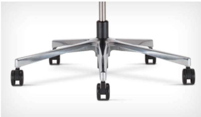
5-star base made of polished aluminium | Fünfarmiges Fußkreuz aus poliertem Aluminium