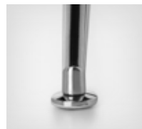
Chromium-plated glides | Verchromte Gleiter