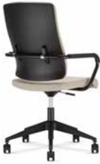
Xenium conference swivel chair X-Cross UPH/Plastic TILT/AR/AG