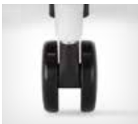
Castors for soft floors | Rollen für Teppichböden