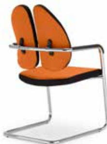
Xenium frame chair CF Duo-Back CFPS-CR/GR