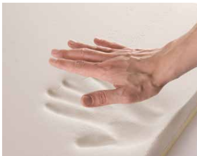
Viscoelastic foam - perfect fit to the user's body shape | Viskoelastischer Schaumstoff - perfekte Anpassung an die Körperform

Ein zusätzlicher Vorteil der Sitzfläche ist die Einstellung der Sitztiefe (in einem Bereich von 100 mm) für Anpassung an die Körpergröße und das Gewicht des Nutzers. Die Seitenböden der Sitzfläche lassen sich optimal mit 3-D-Gewebe polstern.