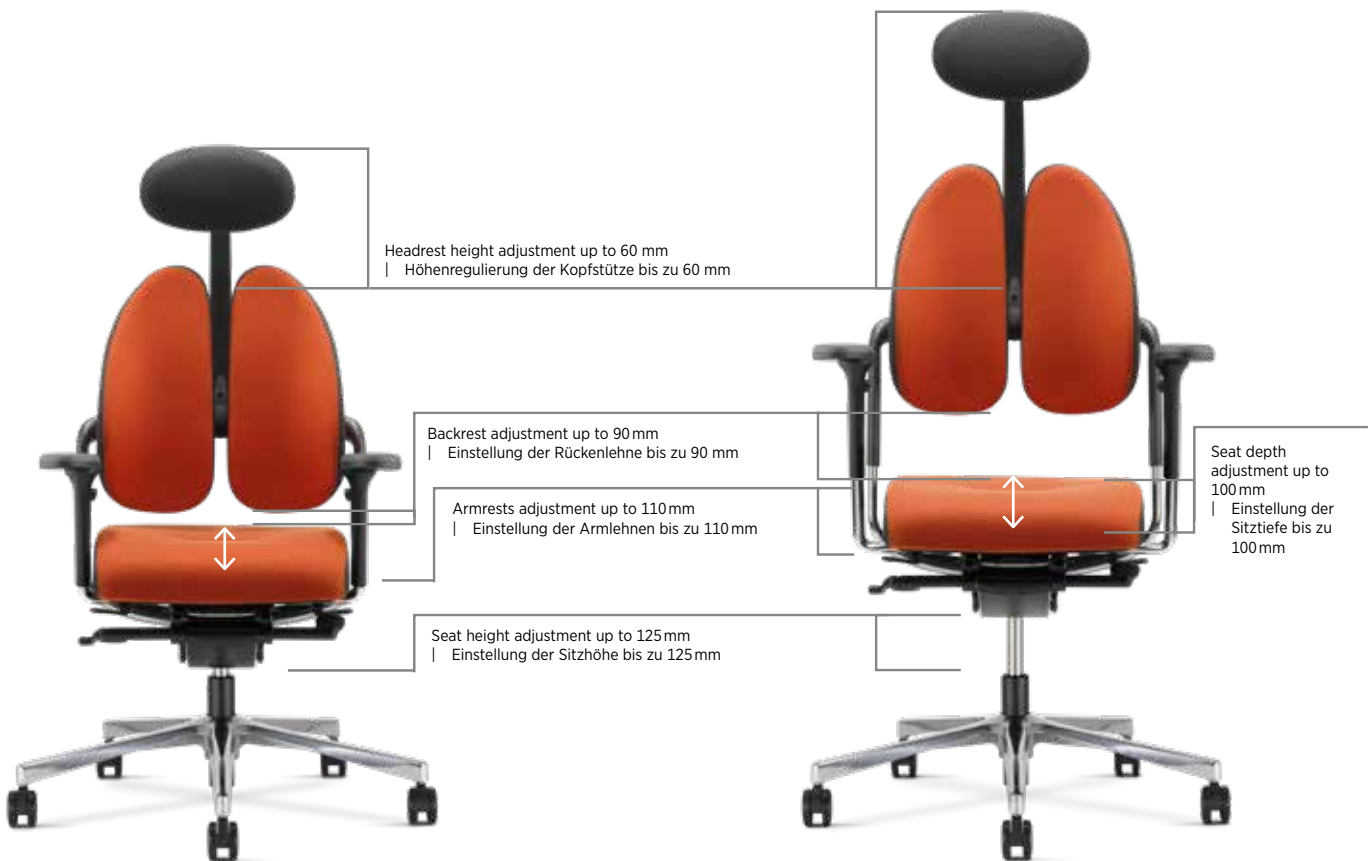
Minimum adjustments range | Minimaler Einstellbereich