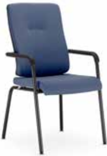
Xenium frame chair 4L UPH/Plastic 4L-ARM-BL/B