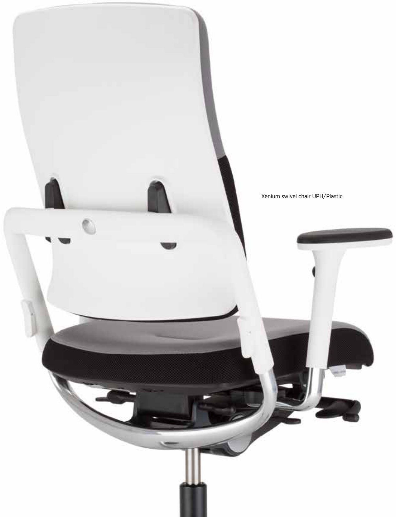
Xenium swivel chair UPH/Plastic

Flexibilität ist eine der wichtigsten Eigenschaften in einem modernen Büro. Die Rückenlehnen der Stuhlserie Xenium sind wahlweise in drei Varianten erhältlich: Duo-Back, UPH/Plastic oder Mesh. Mit dieser breiten Auswahl an Rückenlehnen wird eine individuelle Abstimmung auf den Nutzer und dessen Bedürfnisse für mehr Komfort am Arbeitsplatz ermöglicht. Die Rückenlehnenhöhe kann standardmäßig in einem Bereich von 90 mm eingestellt werden.