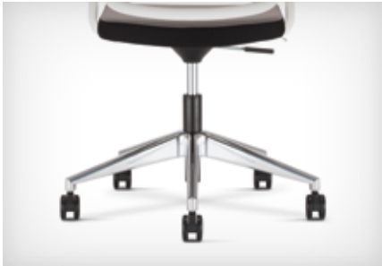
5-star base made of polished aluminium | Fünfarmiges Fußkreuz aus poliertem Aluminium

Für die Konferenz-Drehstühle mit fünfarmigem Fußkreuz gibt es Rollen, lastabhängig gebremst. Konferenz-Drehstühle auf vierarmigen Fußkreuz, ohne Rollen, sind mit verchromten Gleitern erhältlich. Beistellstühle mit Freischwingergestell sind mit Mini-Gleitern oder Kufengleitern, Beisteller mit 4-Fuß-Gestell sind mit Gelenkgleitern für Hart- oder Teppichböden ausgestattet.