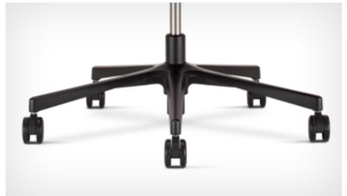
5-star base made of aluminium powder-coated in black | Fünfarmiges Fußkreuz aus pulverbeschichtetem Aluminium, in Schwarz

Das fünfarmige Fußkreuz des Drehstuhls Xenium ist in Kunststoff schwarz bzw. Aluminium poliert oder pulverbeschichtet schwarz wählbar. Die Rollen, lastabhängig gebremst, können an die Beschaffenheit des Fußbodens angepasst werden (für Teppich- oder Hartböden).