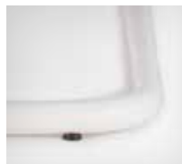
Mini glides | Mini-Gleiter