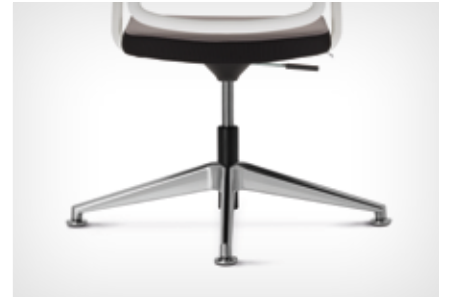
4-star base made of polished aluminium | Vierarmiges Fußkreuz aus poliertem Aluminium