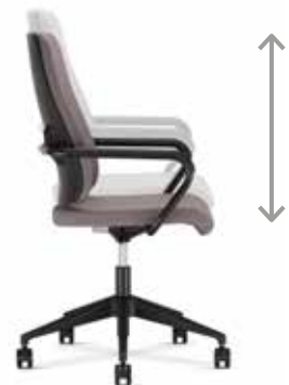
Seat height adjustment | Höheneinstellung des Sitzes