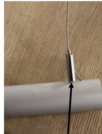
eingeschraubter Befestigungsgripper M4

Wurden alle Befestigungsgripper auf die Rohre geschraubt, kann mit der Deckenbefestigung begonnen werden.