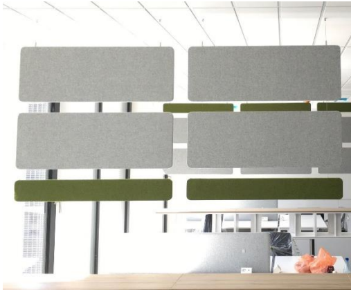
Bild 1 Deckenbaffel Mehrteilig

Bei unseren Deckenbaffel gibt es zwei Systeme. Zum einen gibt es mehrteilige Baffeln die von der Decke abgehängt werden und im Raum enden und zum anderen fertigen wir Baffeln die von der Raumdecke bis zum Fußboden montiert werden (siehe Bild 1 + Bild 2).