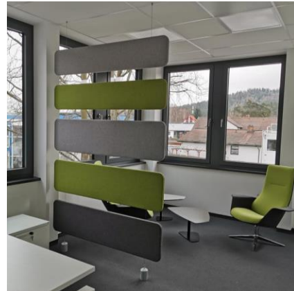
Bild 2 Deckenbaffel Mehrteilig mit Fußgewichten

Die Deckenmontage ist in beiden Fällen identisch. Als erstes muss die Position der Aufnahmen von dem oberen Baffel auf die Decke übertragen werden (siehe Bild 3).